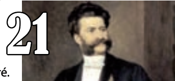
Johann Strauss Jr.