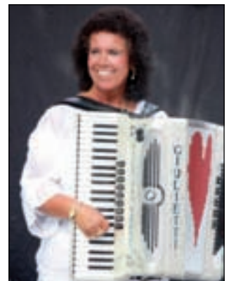
Like ons op Facebook: Van Smartlap tot Opera