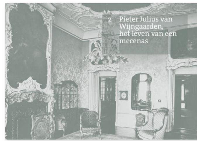
2 Pieter Julius van Wijngaarden, het leven van een mecenas